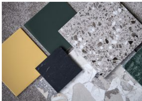
SKARPT GULT, MÖRKT GRÖNT OCH TERRAZZO I GRÅTT. Jet set och 1970-tal är en av trenderna inom kakel.