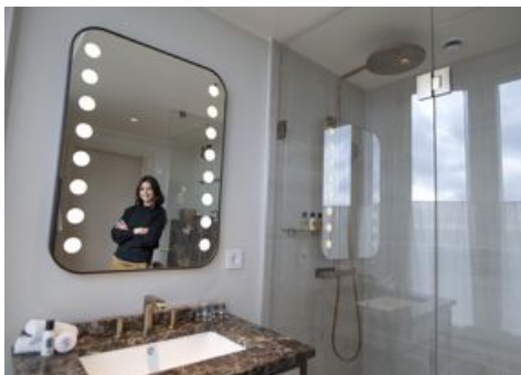
TRENDERNA LÖPER PARALLELLT. Just nu är bland annat terrazzo, där man tar tillvara spill av krossad sten, populärt.