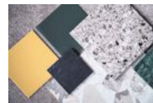
Skarpt gult, mörkt grönt och terrazzo i grått. Jet set och 1970-tal är en av trenderna inom kakel.