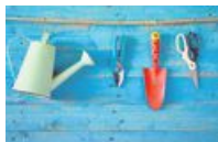
Skapa ordning och reda i boken.