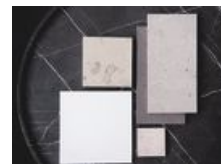
Trenden "neutral och chic". Färgskalan med naturtoner rör sig i creme, vitt, beige och grått.