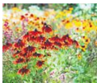
Solhatten hänger med långt in på hösten.