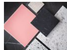
Vad sägs om att låta sig inspireras av den dramatiska sekelskiftetrenden?