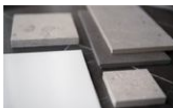
Färgskalan med naturtoner rör sig i creme, vitt, beige och grått.

Att flirta med den tidsepok då huset byggdes blir ofta lyckat, men Noemi Ivanova vill inte att