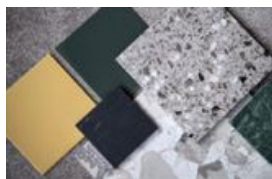
Skarpt gult, mörkt grönt och terrazzo i grått. Jet set och 1970-tal är en av trenderna inom kakel.