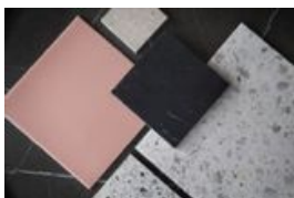
Vad sägs om att låta sig inspireras av den dramatiska sekelskiftetstrenden?

kaklat in badkaret och lagt terrazzo eller svart marmor på golvet. Någon gång kanske jag får skapa mitt eget drömbadrum, men tills vidare får jag nöja mig med att måla taket och satsa på snygg förvaring, säger hon och skrattar.