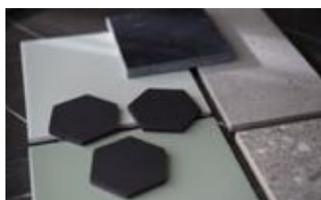
Hexagonformade plattor i svart är en trend.

- Bostadsvisningar är lite som att dejta. Vill man ha någon som ser ut exakt som alla andra, tycker som alla andra och inte har någon egen personlighet? Jag tänker tvärtom.