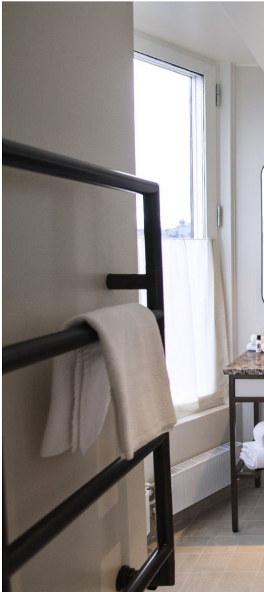
”När jag insåg hur lite hjälp man får när man ska inreda sitt badrum, trots att det är