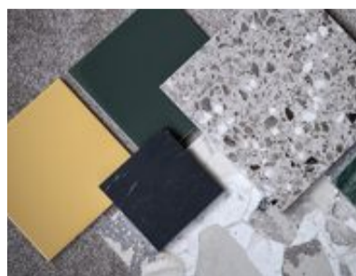
Skarpt gult, mörkt grönt och terrazzo i grått. Jet set och 1970-tal är en av trenderna inom kakel.