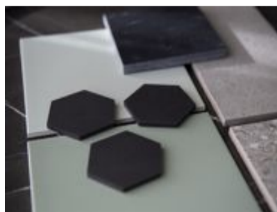
»Hexagonformade plattor i svart är en trend.

» Jag märker att det lätt skapar stress att tänka i tids-epoker.