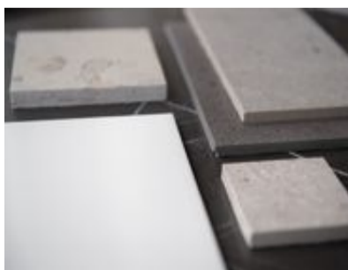
»Färgskalan med naturtoner rör sig i creme, vitt, beige och grått.

rummet. Titta på hur du bor, vad du har för färg på soffan och vad du gillar för stil och ta in det i badrummet. (TT)